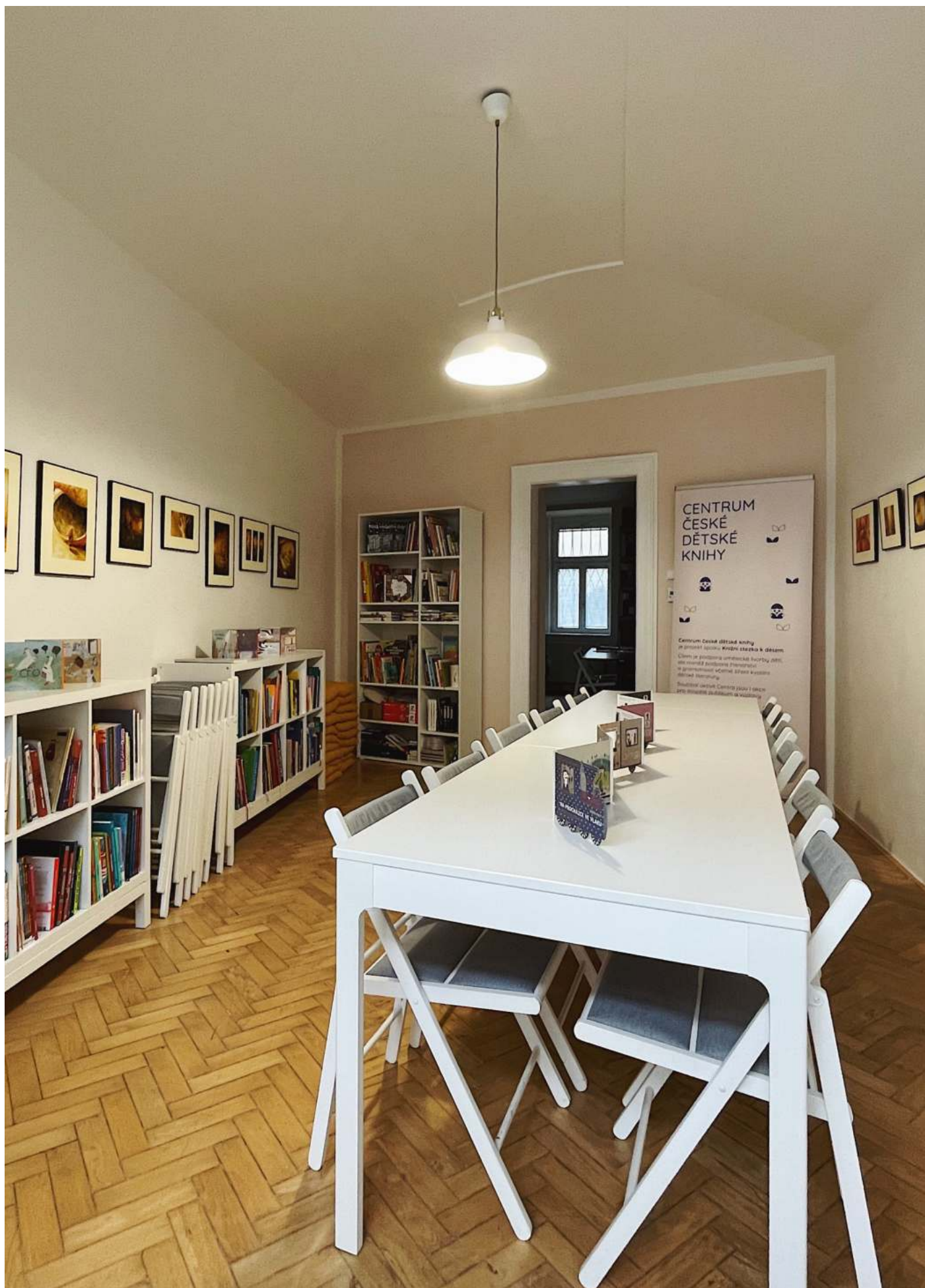
Nové prostory Centra české dětské knihy ve Vratislavově ulici.