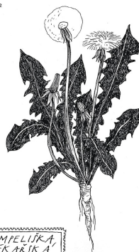
PAMPELIŠKA LEKÁŘSKÁ Taraxacum officinale