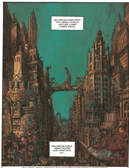
Nicolas de Crécy: Nebeský bibendum